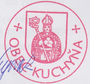
Obec Kuchyňa Róbert Bujna, starosta

podľa osvedčovacej knihy č. 411/2015 ..... podpis uzna za svoj podpis / číslo listiny MARIÁN ZEMBĽAK od. č. G5 0703 / 0790 vidim HEJER 076 sukaz totožnosti; druh a číslo: 076 EB 880 936 Liesku dňa 22.05.2015 podpis: [Signature]